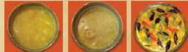
Indian Chicken Curry インディアンチキンカレー Shrimp Curry シュラブ(エビ)カレー Vegetable Curry ベジタブルカレー